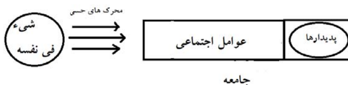
شکل ۳. مدل کانتی بلور

توجه کنیم که ساخت‌گرایانی چون کوهن و بلور نیز از مطابقت سخن می‌گویند، اما نه مطابقت نظریه با خود واقع (شیء فی نفسه)، بلکه مطابقت نظریه با جهانی که پارادایم یا جامعه برای دانش‌مندان برمی‌سازد؛ از این رو تعجبی ندارد که بلور به‌صراحت می‌گوید «مطابقت، مطابقت نظریه با خودش است» (Bloor, 1981: 38). نظریه با عوامل اجتماعی متعین می‌شود، و این نظریه جهانی را تصویر می‌کند که می‌خواهد خود را با آن مطابقت دهد؛ در واقع، نظریه خود را با چیزی مطابقت می‌دهد که خودش تصویر کرده است.