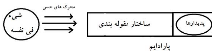
شکل ۲. مدل کانتی کوهن

منتقل می‌شویم. بنابراین، نه تنها مشکل شکاکیت و بریده بودن از جهان بر جای خودش باقی است، بلکه مسئله بغرنج‌تری بروز می‌یابد؛ مسئله‌ای که حداقل کانت با آن مواجه نبود: قیاس‌ناپذیری و نسبی‌گرایی. مقولات فاهمه برای کانت ثابت و یک‌سان‌اند؛ در نتیجه حداقل این تضمین وجود دارد که همه انسان‌ها در جهان‌پدیداری مشترکی زندگی کنند. اما برای کوهن و بلور هر پارادایم یا جامعه‌ای جهان را به نحو خاصی مقوله‌بندی و متعین می‌کند؛ و این جهان‌ها با هم قیاس‌ناپذیرند. دانش‌مندان نیوتنی و نسبیتی در دو جهان (پدیداری) متمایز زندگی می‌کنند و امکان آن نیست تا مشخص شود کدام‌یک از این جهان‌ها با جهان واقع (نومن) منطبق است؛ چرا که ما دسترسی و تجربه فرایارادایمیکی در اختیار نداریم. نمودارهای زیر به ترتیب بیان‌گر رابطه جهان و پارادایم و جامعه در نظر کوهن و بلورند و تفاوت و شباهت آن را با مدل کانت نشان می‌دهند: